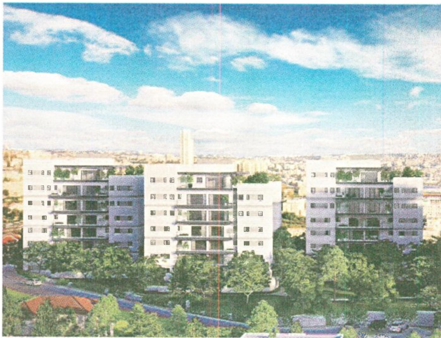
הפרויקט בקרית יובל בירושלים של חברת צברים | הדמיה: Viewpoint

היא כבר לא אקטואלית), עושות סדר בעניין וקובעות מדיניות בנושא ההתפשטות וההתרחבות של העיר ביחד עם עיבוי התחדשות עירונית.