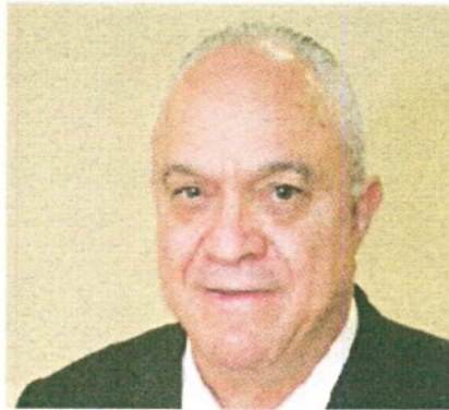
יהודה כתב

בשכונת קרית יובל המתחדשת בירושלים מקימה חברת צברים פרויקט התחדשות עיר רונת הכולל 5 בניינים בשכונת יובל בירושלים. בסך הכל הפרויקט יכול לל 150 יחידות דיור על פני 5 בניינים בני 7 קומות ברחוב הציונות