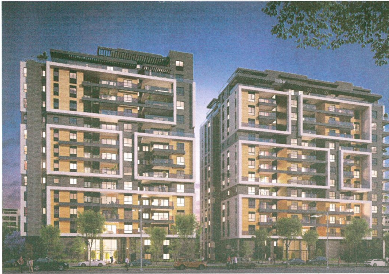
פרויקט פיניו-בינוי מתחם מטרופוליס הרצליה ברחובות מנדלבלט אבן עזרא | הדמיה: olin

וההתעוררות האורבנית שכבר באים לידי ביטוי בשכונה ובסביבתה בפרויקטים שנמצאים בבנייה מתקדמת ולקראת אכלוס.